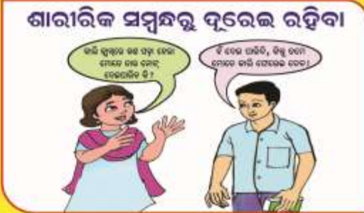
ଶାରୀରିକ ସମ୍ବନ୍ଧରୁ ଦୂରେଇ ରହିବା