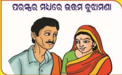
ପରସ୍ପର ମଧ୍ୟରେ ଭଲମ ବୁଝାମଣା