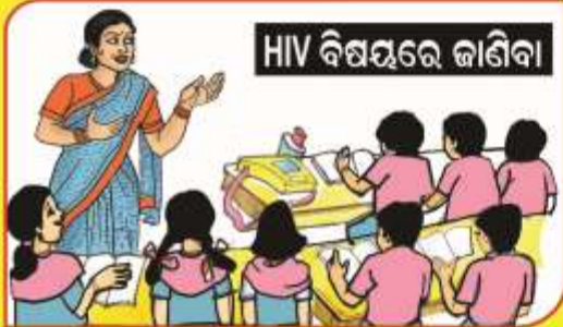
HIV ବିଷୟରେ ଜାଣିବା